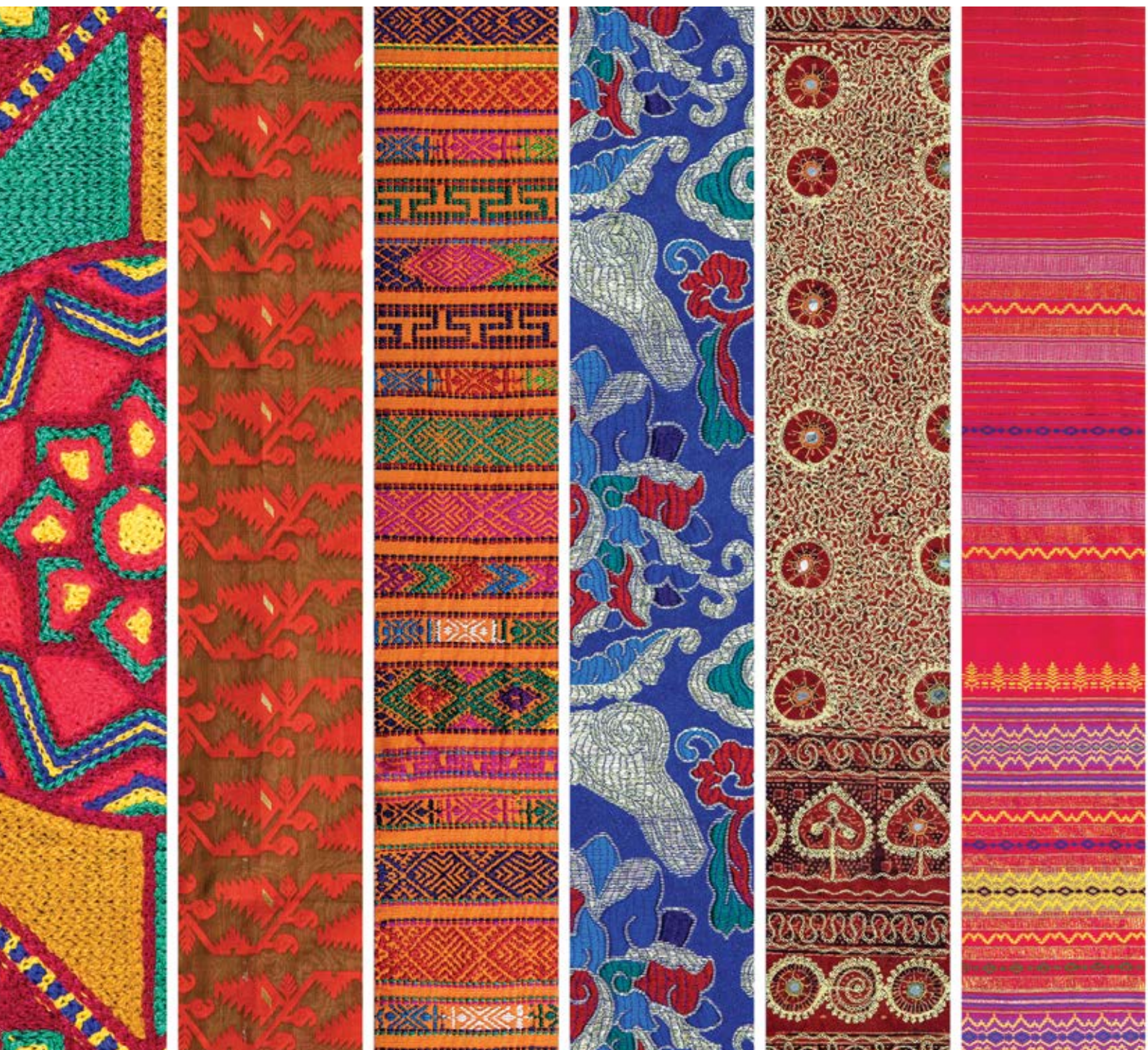
如图，纺织面料的花纹设计来自ICIMOD八个区域成员国，从左到右依次为：阿富汗、孟加拉国、不丹、中国、印度、缅甸、尼泊尔、巴基斯坦