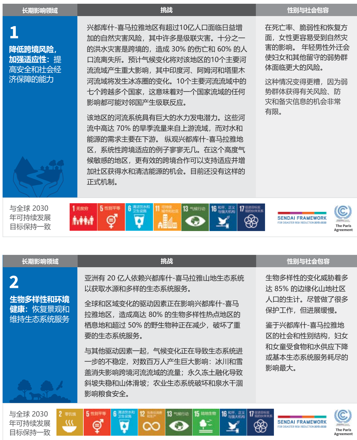
影响领域和全球目标