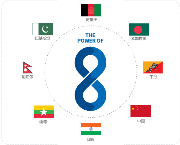
图二 ICIMOD - 八个国家力量的凝聚

ICIMOD凝聚八个HKH地区区域成员国的力量，借助区域和国际协作在该地区开展气候和环境行动。