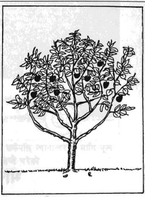
परागसेचन नभएकोले उत्पादन कम भएको