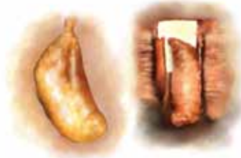
ख) थैलो जस्तो आकारको छाउराहरू