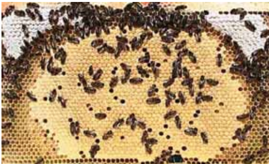
क) स्वस्थ छाउरा चाका