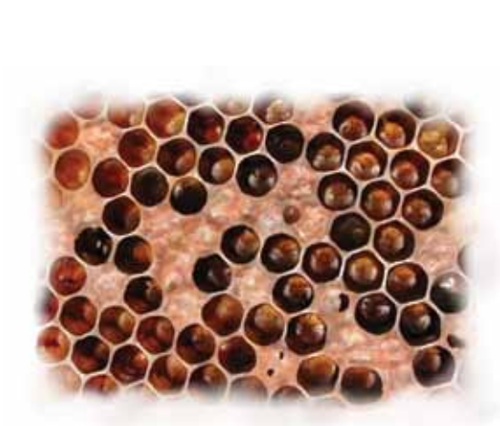
ग) संक्रमित लार्भा