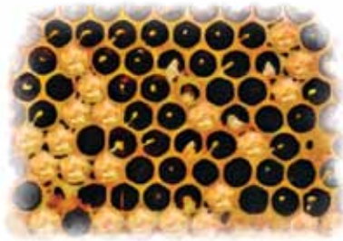
क) छाउरा र पूर्वप्युपा