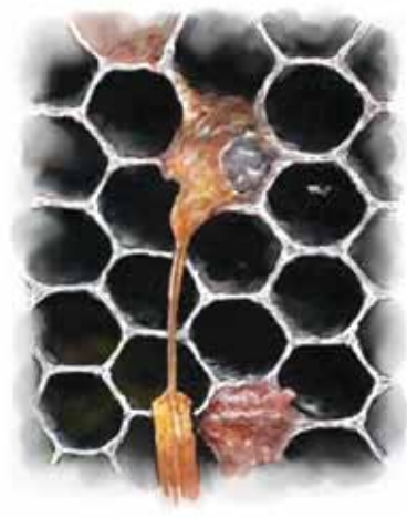
घ) रेपिनेश जाँच (Rapines test)