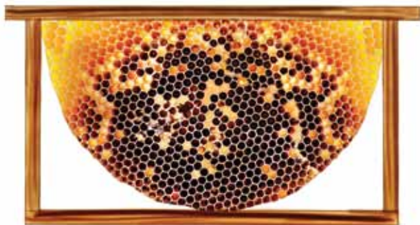
ख) संक्रमित छाउरा चाका