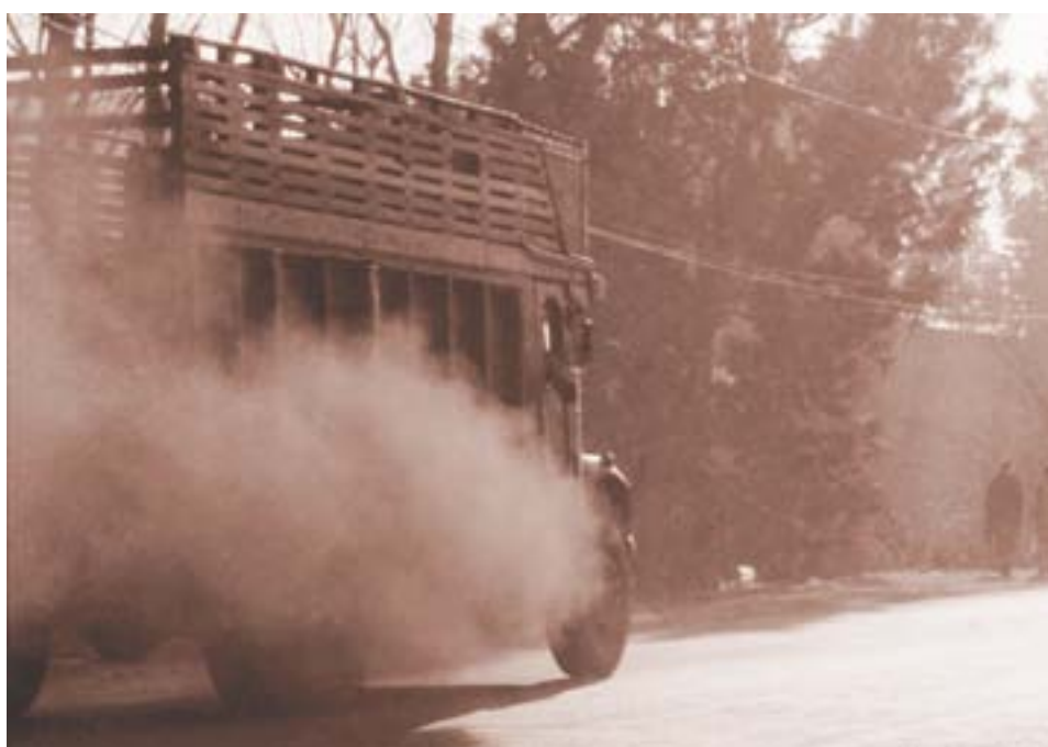
नेपालमा वातावरण प्रदूषण गर्दै डिजेल ट्रक

नेपालका सीमान्तकृत भन्नाले केवल वर्ग, जाति, आदिवासी तथा धार्मिक अल्पसंख्यकलाई मात्र बुझाउँदैन, यसले मूल प्रवाहबाट अलग्याउनुलाई समेत बुझाउँदछ।