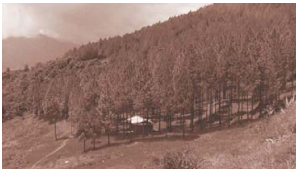
पहिलेको उजाद भूमिमा सामुदायिक वन, नेपाल

गोदावरी मार्बल मुद्दामा सफा र स्वस्थ वातावरणमा बाँच्न पाउने हकलाई संविधानको धारा १२(१) अन्तर्गत मौलिक हक हो भनी निर्णय गरिएको छ । त्यसैगरी यस फैसलामा प्रत्यक्ष रूपमा प्रभावित नभएका गैर-सरकारी संस्था र व्यक्तिहरूले पनि मुद्दा दायर गर्न सक्दछन् र गोदावरी क्षेत्रको वातावरण संरक्षणको लागि कानून तर्जुमा गर्नु भनी सरकारको नाममा निर्देशनात्मक आदेशसमेत जारी भएको छ ।