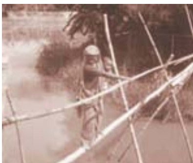
बाढीको पानी तर्दै महिला, बङ्गलादेश

यही आदर्शलाई पछ्याउँदै बङ्गलादेशको न्यायपालिकाले स्वच्छ वातावरणमा बाँच्न पाउने मौलिक हकलाई बाँच्न पाउने मौलिक हकको एक भागको रूपमा सृजना गर्‍यो । बङ्गलादेशको संविधानमा बाँच्न पाउने हकलाई प्रष्ट रूपमा न संवैधानिक अधिकारको रूपमा न त निर्देशक सिद्धान्त (यो व्यवस्थाले सरकारको कामलाई मार्ग निर्देशन प्रदान गर्दछ तर यसले कुनै अधिकारको सृजना गर्दैन) को रूपमा नै व्यवस्था गरिएको छ । तर पनि बाँच्न पाउने मौलिक हकको सृजना गर्ने क्रममा न्यायपालिकाले यी दुवै प्रावधानहरूलाई संगसंगै व्याख्या गरेको छ, जसको विस्तृत रूपमा पछि व्याख्या गरिनेछ । बाँच्न पाउने हकको अवधारणालाई ग्रहण गर्दै बङ्गलादेशको न्यायपालिकाले स्वच्छ वातावरणको अधिकारलाई बाँच्न पाउने हकको एउटा भागको रूपमा लिएको छ ।