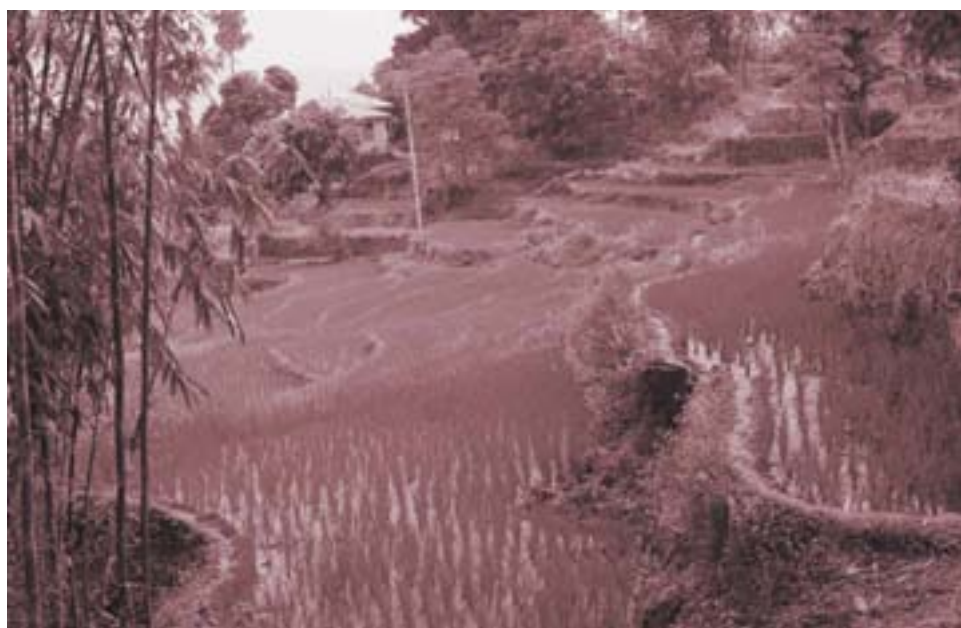
दार्जिलिङमा धान खेतीको जराहरू

भारतीय न्यायालयले स्वच्छ, स्वस्थ वातावरणमा बस्न पाउने अधिकार बाँच्न पाउने अधिकार भित्र पर्दछन् भनी गरेको व्याख्या दक्षिण एशियामा नै पहिलो हो।